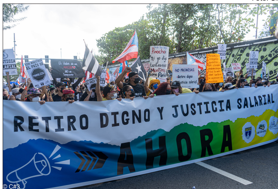
La FMPR ha sido factor clave en la organización de las luchas magisteriales durante más de 50 años. En la foto, el FADEP participando de las protestas por justicia salarial y un retiro digno.

La administración ha cerrado programas académicos o los ha puesto en moratoria, ha dejado caer la planta física y los predios agrícolas en un marcado y acelerado deterioro, que junto a la más que alarmante baja en la matrícula, siguen anunciando el fin de la UPRU. Llama la atención, hasta ahora, el silencio de parte del profesorado, los sindicatos y el estudiantado del recinto. ■