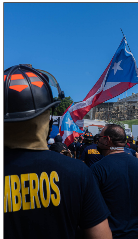
Protesta de Bomberos en solidaridad con el magisterio en lucha durante el 2022. Este proceso garantizó aumentos salariales a ambos sectores e la clase trabajadora.