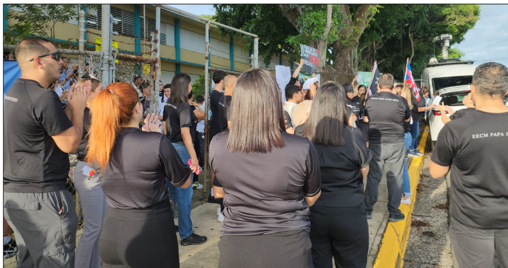
Protesta magisterial por los problemas de planta física y calor que afectan las escuelas públicas desde abril hasta octubre.