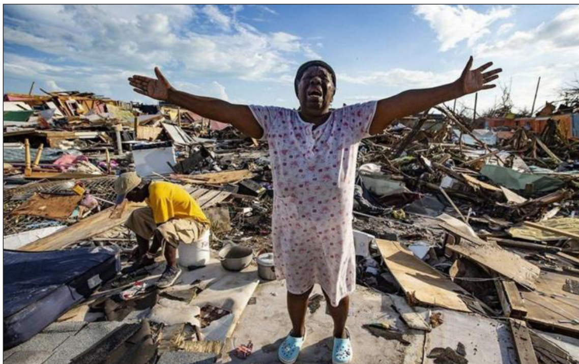
La inestabilidad política y económica de Haití es consecuencia de la intervención de países imperialistas como Francia y Estados Unidos.

Aristide es electo nuevamente presidente en el 2000, pero es depuesto por un nuevo golpe de estado en el 2004. Ante la crisis social y política de los últimos años del gobierno de Aristide y luego de su secuestro y exilio, las Naciones Unidas aprueban una intervención y ocupación militar del país que lleva como nombre la "Misión de Estabilización de las Naciones Unidas en Haití" (MINUSTAH). Haití será ocupado por estas fuerzas extranjeras hasta el 2017. Durante este tiempo, las condiciones de vida de la población haitiana empeoraron, y se suman las denuncias de los abusos cometidos por las fuerzas de ocupación durante el periodo (asesinatos, violaciones, abuso y explotación de menores, ...). En el 2010, Haití sufrió los estragos de un terremoto de gran magnitud que dejó un saldo de más de 300 mil muertos y de 1.5 millones de personas sin